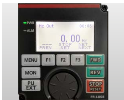
FR-LU08 mit Volltextanzeige in bis zu fünfzehn Sprachen und mit Echtzeituhr.

Mit dem integrierten „Digital Dial“ der Bedieneinheit hat der Anwender einen direkten Zugriff auf alle wichtigen Parameter. Entscheiden Sie sich für die Bedieneinheit, die Ihren Anforderungen gerecht